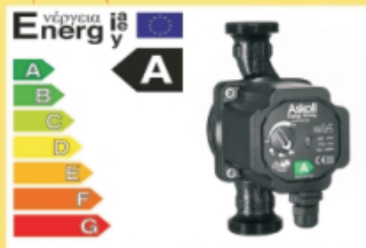
Umwälzpumpen Klasse A stufenlos gesteuert

Das Konzept, Amortisationszeit 5,6 Jahre ohne Abschreibungen und Förderungen