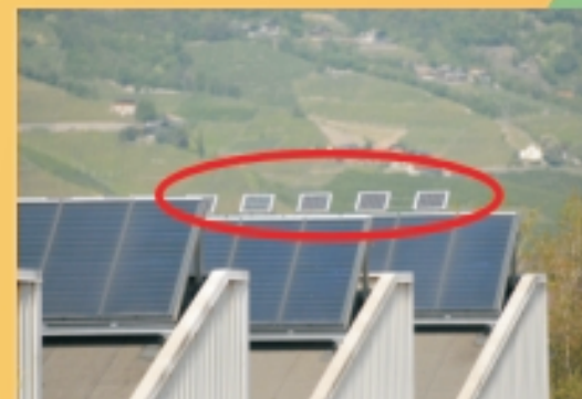
Stillstandssichere thermische Solaranlage

Das Konzept, Amortisationszeit 5,6 Jahre ohne Abschreibungen und Förderungen