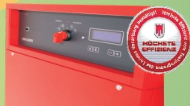
Wärmepumpe COP 6,7 Grundwasser W10 / W35

Weitere Vorführungen sind geplant - info Tel. 0473 292072 oder www.solaria-lana.it Solaria Lahnstr. 30 39011 Lana