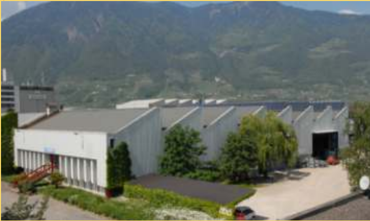
Klimatisiertes Produktions- und Bürogebäude von 2.250 m 2