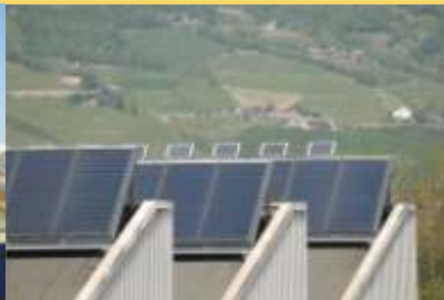
Thermische Solaranlage 240 m 2