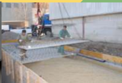
Pufferspeicher 100 m 3