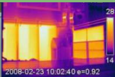
Paneele zum Heizen und Kühlen 385 m 2

Solaria präsentiert Ihnen schon heute die Lösung Ihrer alternativen Energie- produktion um für alle eine Zukunft mit Energie zu garantieren