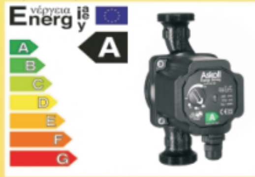
Pompe di ricircolo a velocità variabile, classe A

Il concetto: ammortizzare i costi in 5,6 anni al netto di eventuali contributi e detrazioni fiscali