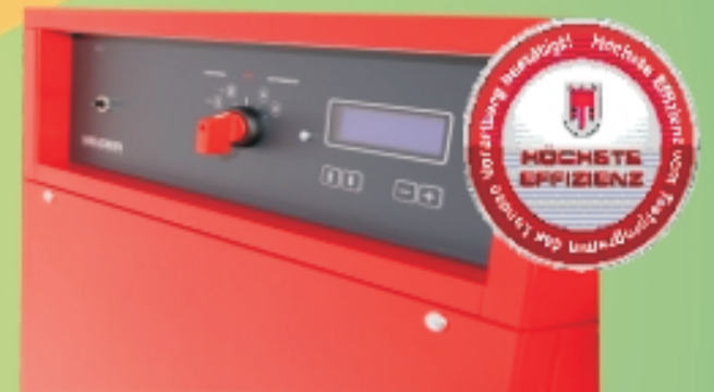
Pompa di calore COP 6,7 acqua di falda W10 / W35

Organizziamo visite guidate - info Tel. 0473 292072 - www.solaria-lana.it Solaria Via della Rena, 30 Lahnstr. 39011 Lana