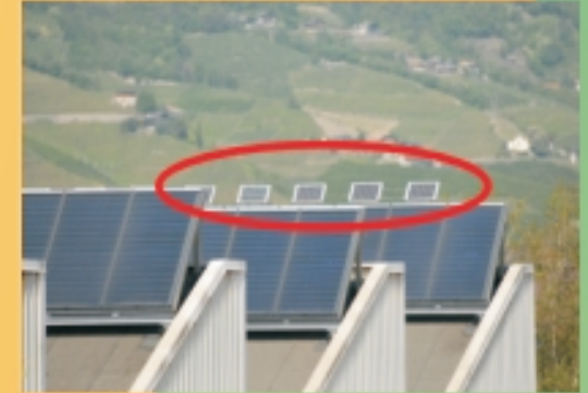
Solare termico con protezione totale

Il concetto: ammortizzare i costi in 5,6 anni al netto di eventuali contributi e detrazioni fiscali